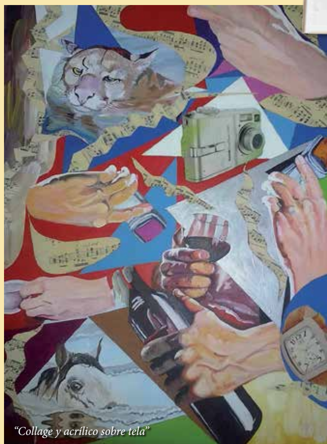
"Collage y acrílico sobre tela"