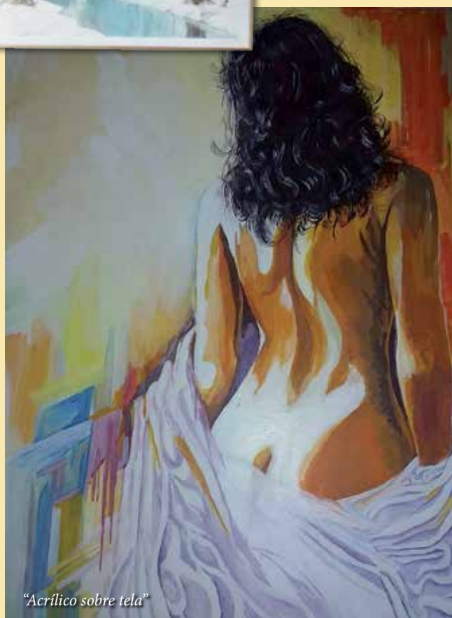
"Acrílico sobre tela"